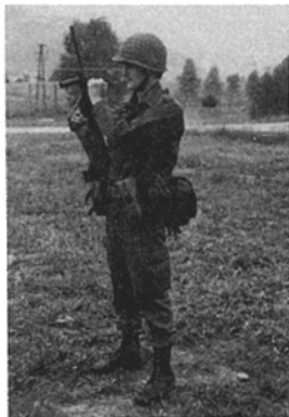
Abb. 5: Prüfen der Sicherheit