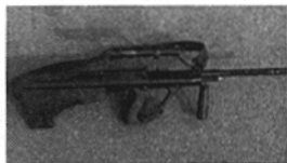
Abb. 10: Abstellen des StG 77 auf der Schießstätte