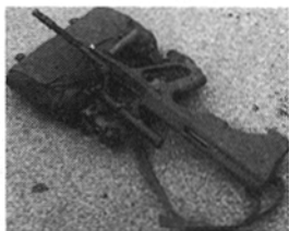
Abb. 9: Ablegen des StG 77 auf der Rüstung auf der Schießstätte