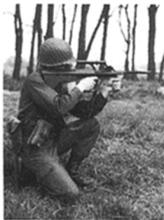
Abb. 13: Anschlag knieend frei