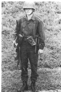
Abb. 11: Waffe am Griffstück