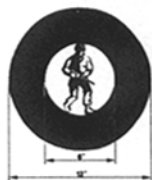
Abb. 4: Kreisabsehen

Das mechanische Visier (Kimme und Korn, neue Ausführung mit Leuchtpunkten) ist nicht verstellbar und dient als Behelfsvisier . Es wird nur dann verwendet, wenn das Zielen durch das optische Visier nicht möglich ist.