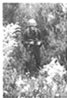
Abb. 17: Hüftanschlag