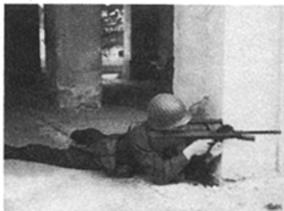
Abb. 12: Anschlag liegend angelehnt