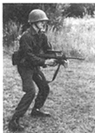
Abb. 18: Anschlag frei vor Körpermitte