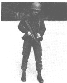
Abb. 6: Ladestellung

Bei allen Tätigkeiten ist der Abzugsfinger gestreckt entlang der Außenseite des Abzugsbügels zu halten.