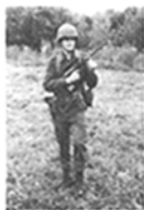
Abb. 16: StG 77 vor der Brust

Während der Bewegung kann das StG 77 bei Annäherung an den Feind oder im Gefecht zur raschen Feuereröffnung in folgenden Haltungen (s. Abb. 16 bis 19) getragen werden: