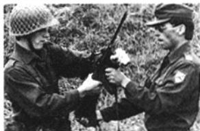
Abb. 7: Übergabe des StG 77