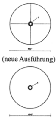
Abb. 3: Blickfeld 1 Kreisabsehen

Im Einblick ist das Kreisabsehen , (s. Abb. 4) das zum Zielen dient, sichtbar. Der Innendurchmesser des Kreisabsehens beträgt 6" . Das bedeutet, daß ein in 300 m Entfernung stehender Soldat mit einer Körpergröße von 1,80 m den Innenkreis der Höhe nach genau ausfüllt.