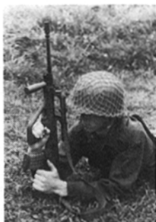
Abb. 8: Verhalten bei Auftreten einer Hemmung in der Bewegung

Auf der Schießstätte ist das StG 77 auf der Rüstung gemäß Abb. 9 abzulegen mit: