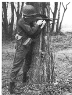
Abb. 14: Anschlag stehend angelehnt